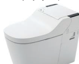
うずまき水流5.7ℓ洗浄