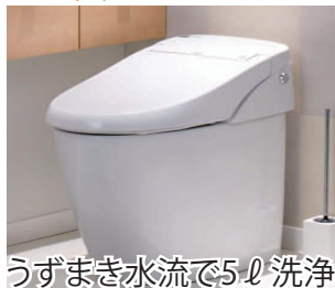
うずまき水流で5ℓ洗浄